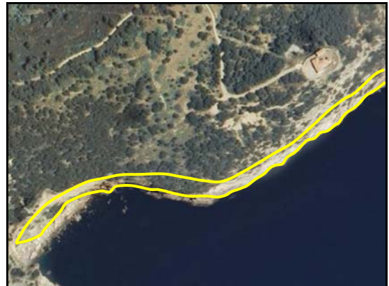
Escarpado – TIPO_0004: “/acantilado”